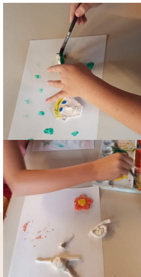
L'école du dimanche a eu lieu le 22 octobre à Eckwersheim.