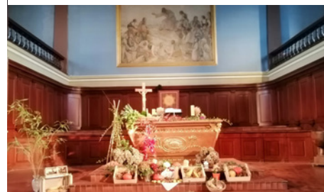
À Brumath, le culte des récoltes a eu lieu le 19 octobre.