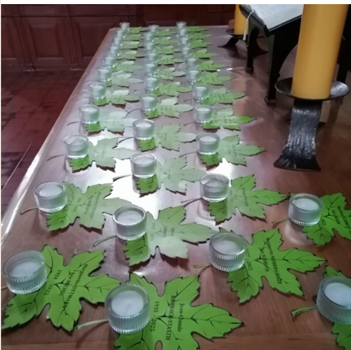
Lors du culte du 16 novembre, nous nous sommes souvenus des 35 personnes qui nous ont quittés au cours de cette année liturgique.