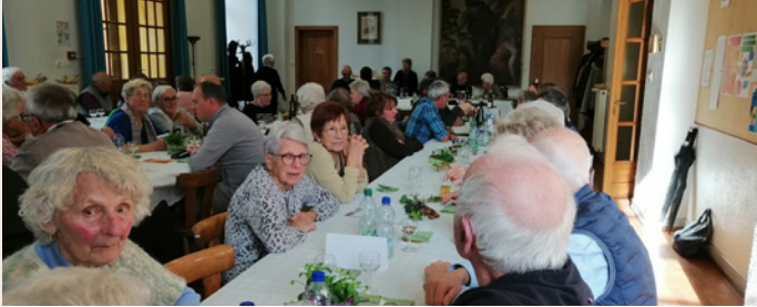
Les convives qui ont dégusté des délicieuses bouchées à la reine préparées par le traiteur Specht.