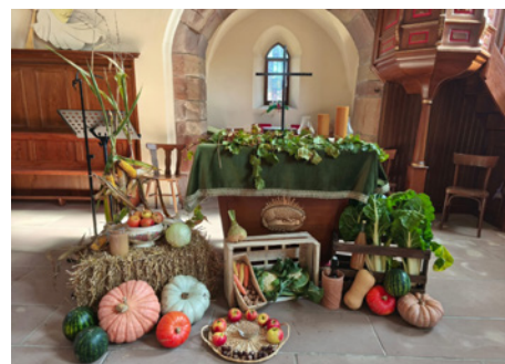
À Eckwersheim, le culte des Récoltes a eu lieu le 12 octobre